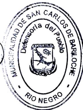
ANALÍA WOŁOSZCZUK Defensora del Pueblo San Carlos de Bariloche ORD. 3227-CM-21