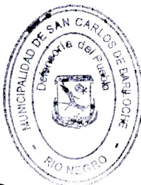
ANALÍA WOŁOSZCZUK Defensora del Pueblo San Carlos de Bariloche ORD. 3227-CM-21