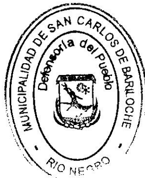
ANALÍA WOŁOSZCZUK Defensora del Pueblo San Carlos de Bariloche ORD. 3227-CM-21